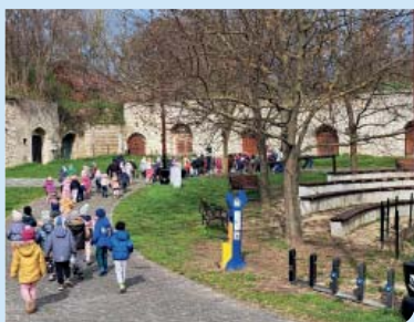
Etyeki pezsgőkultúra 6