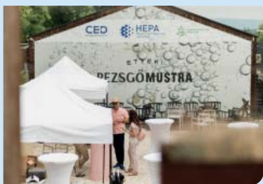
Új beruházások Etyeken 7